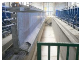
Stav - "PRED" - východiská projektu